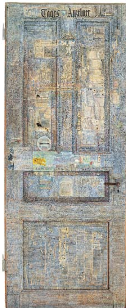
Pierre Baltensperger | Zeitungstüre | 1989 | Artista suíço

1. Escolha da Suíça como porta de entrada da Europa para filiais de empresas brasileiras.