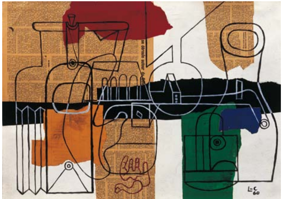
Le Corbusier | Bouteilles | 1960 | Artista suíço