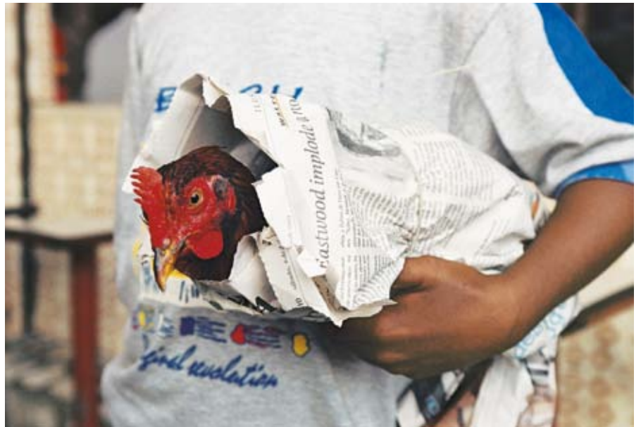
José Bassit | Galinha embrulhada no jornal [in Zeitung eingewickeltes Huhn] | 2003 | Artista brasileiro

7. Suporte profissional quando da chegada: assessoria competente, facilidades tributárias e possibilidades de incentivo financeiro.