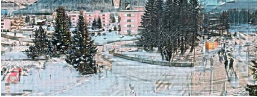
Jules Spinatsch | Temporary Discomfort Chapter IV, Pulver gut [Panorama B251356: Anti-WEF World Economic Forum Demonstration, Davos-CH, 25 January 2003. Camera B: Hertistrasse, Talstrasse, Congress-Center South Entry, Kurpark; 1740 still shots from 13h56–17h15] | 2003 | Artista suíço

1. Localização estrategicamente favorável: três dos quatro maiores mercados da Europa são países vizinhos da Suíça (Alemanha, França e Itália). A localização central da Suíça e o fuso horário de 3 a 5 horas à frente do Brasil (dependendo da estação) facilitam o contato e os negócios com todos os continentes.